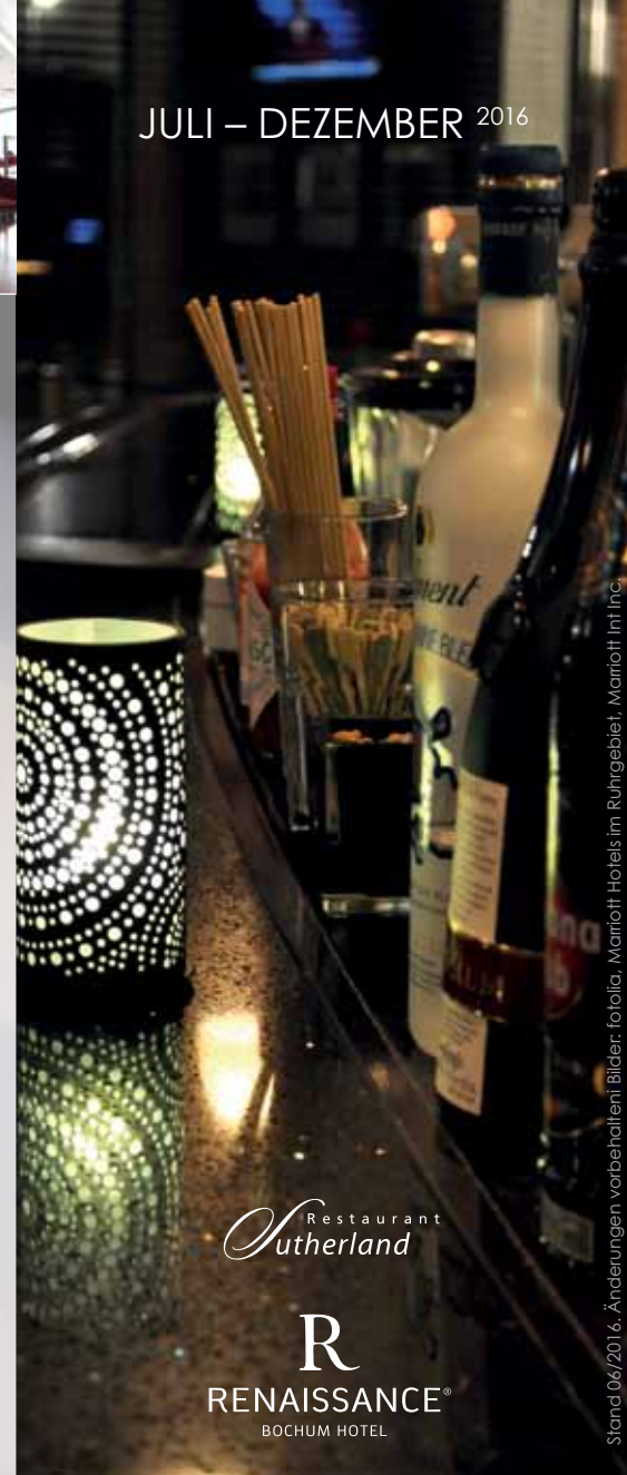
Stand 06/2016, Änderungen vorbehalten!