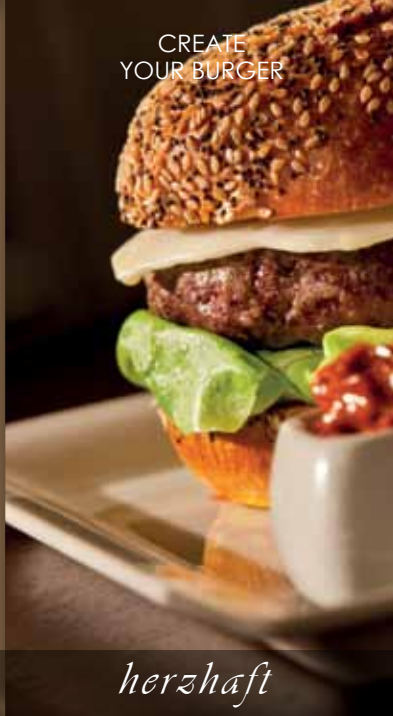
CREATE YOUR BURGER